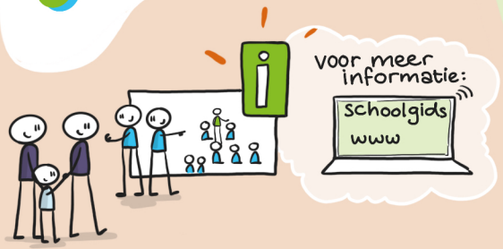
1. Kennismaking en rondleiding