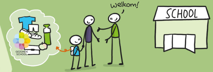
10. Vanaf de 1e schooldag