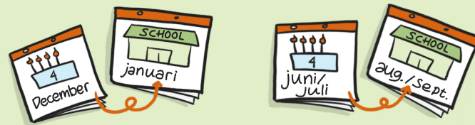
8. Starten december/juni/juli leerlingen