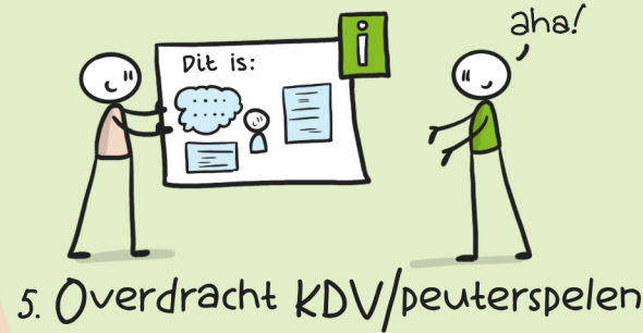
5. Overdracht KDV/peuterspelen