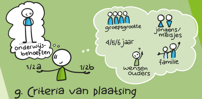
9. Criteria van plaatsing