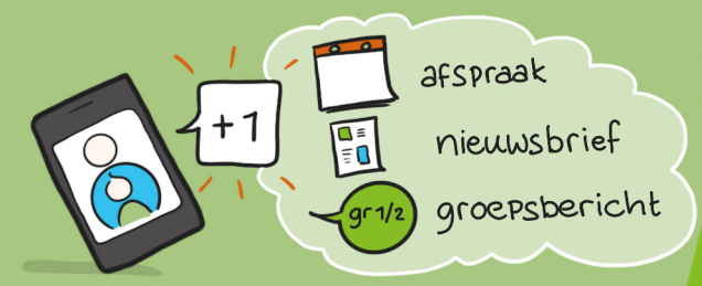
11. Het ouderportaal