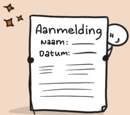
2. (Voor) aanmeldformulier